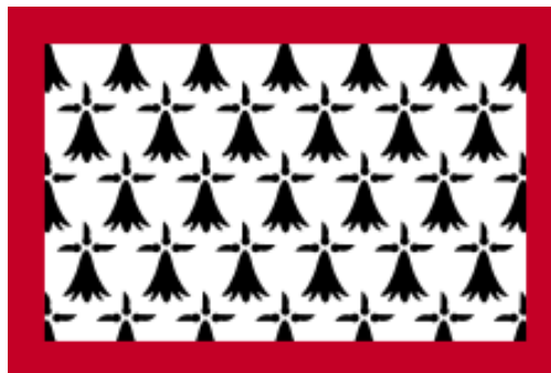
Drapeau du Limousin