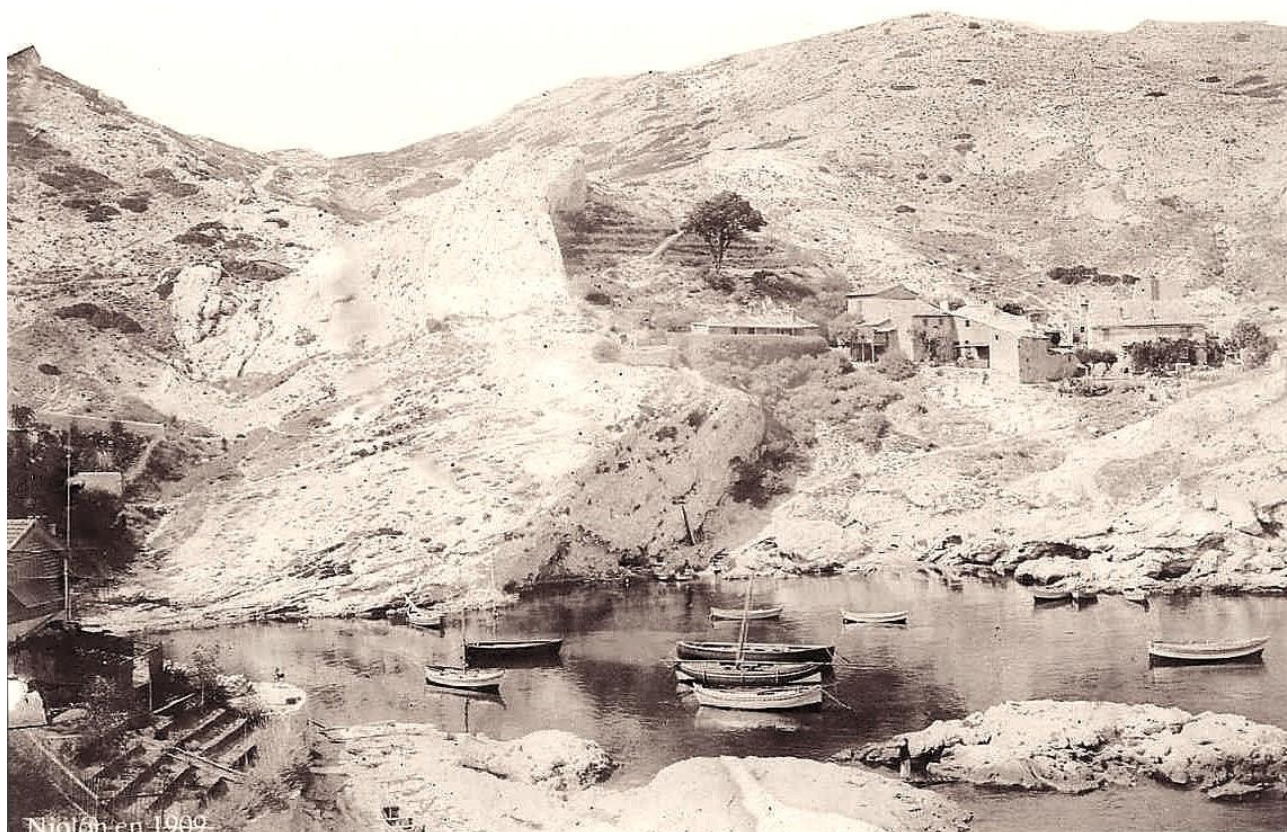
Niolon en 1909

Le village de Niolon est principalement constitué, au sud du port, par le centre de plongée de l'UCPA (centre fédéral FFESSM) situé dans un ancien fort militaire construit en 1860 et ayant été occupé par les Allemands lors de la Seconde Guerre mondiale. Quelques habitations et commerces (restaurants, bars, épicerie...) complètent le tout.