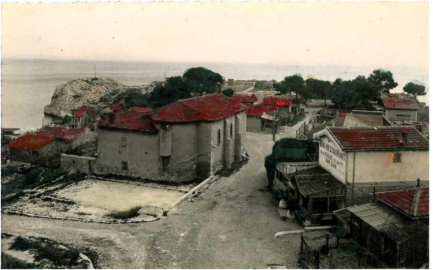
L'église, années 1950, carte postale colorisée