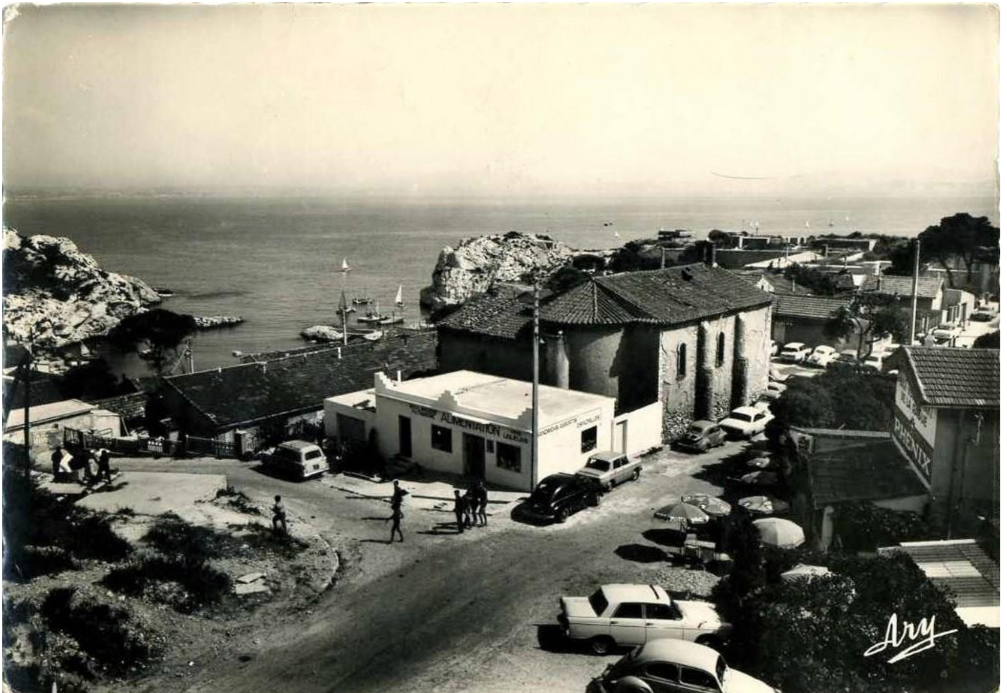
L'église, années 1960