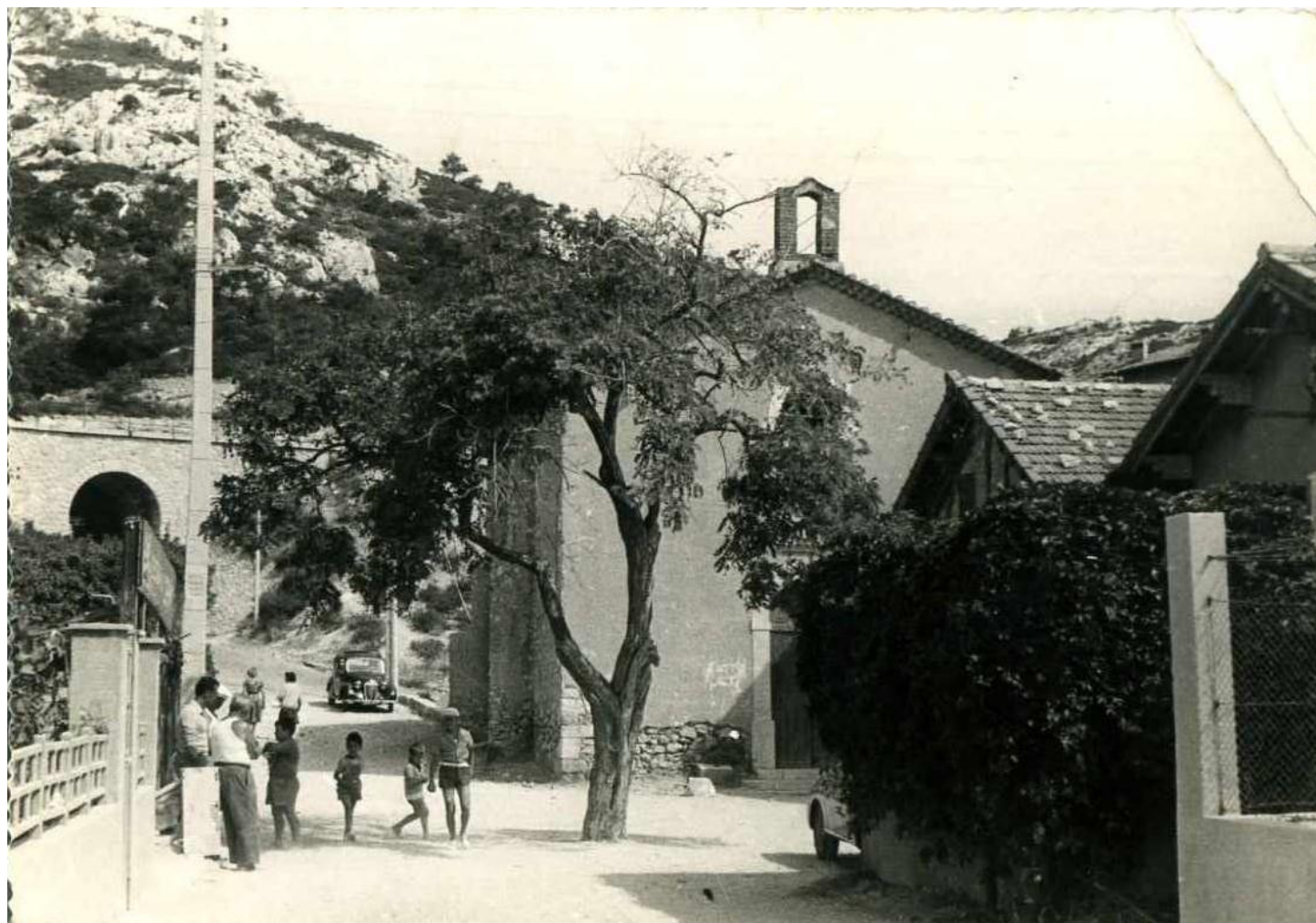
Place de l' glise, 1955