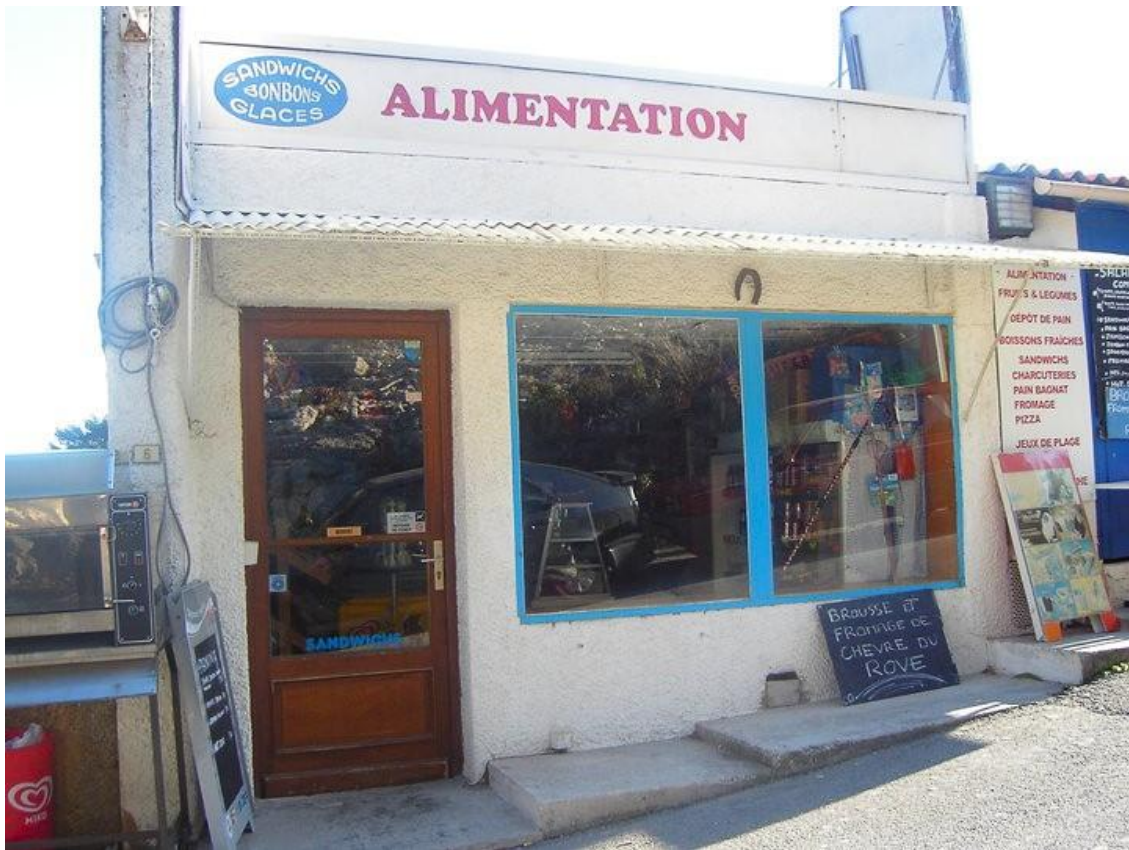
L'épicerie en 2010