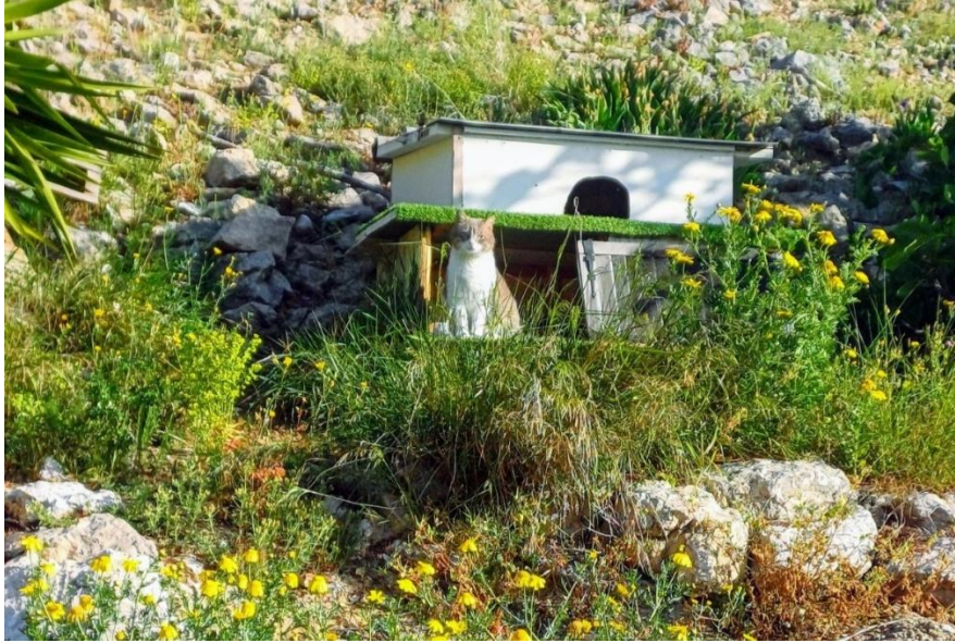
Cabanon félin, fabriqué par JeanJean (Photo Lantéri, 04/2024)