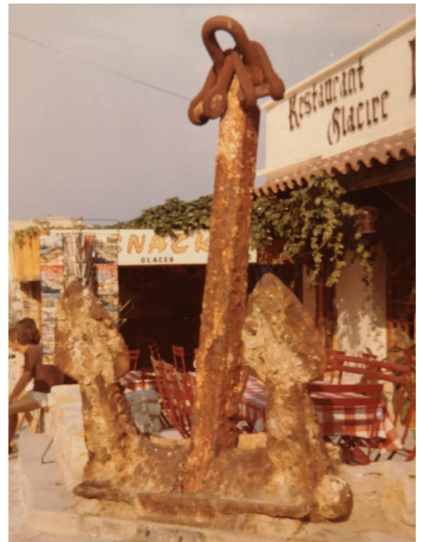
Installation de l'ancre en juillet 1967