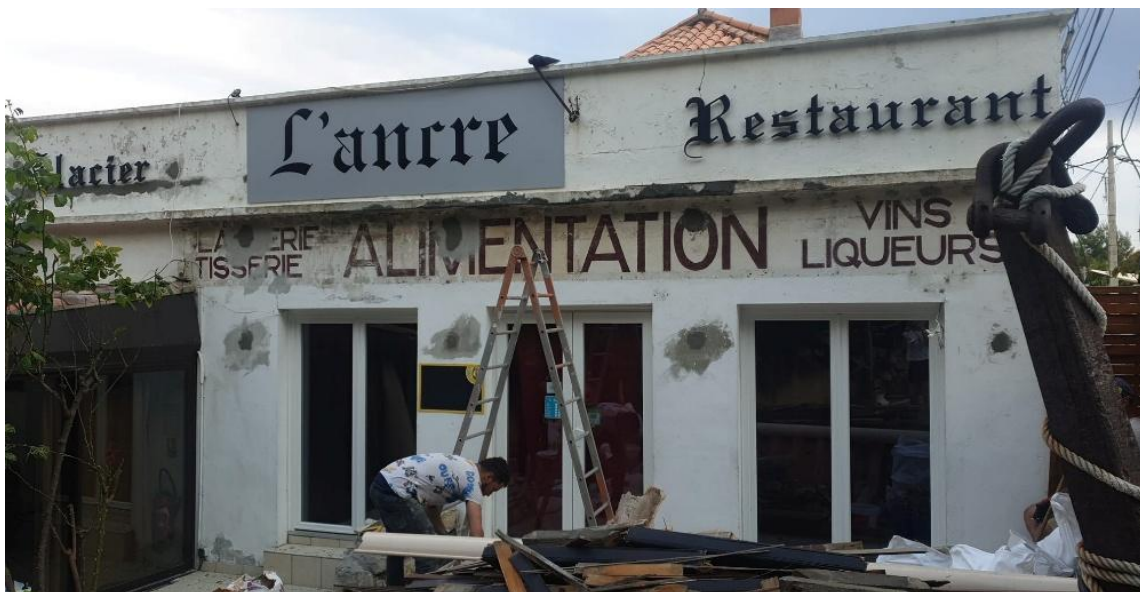
L'Ancre et l'épicerie durant les travaux de rénovation en mai 2020

- 2026 : fin mars, publication Facebook de Meissa Zaoui : « À compter du 1er avril nous serons ouvert 7 jours sur 7, pour Info l'épicerie est à l'Ancre désormais. À très bientôt »