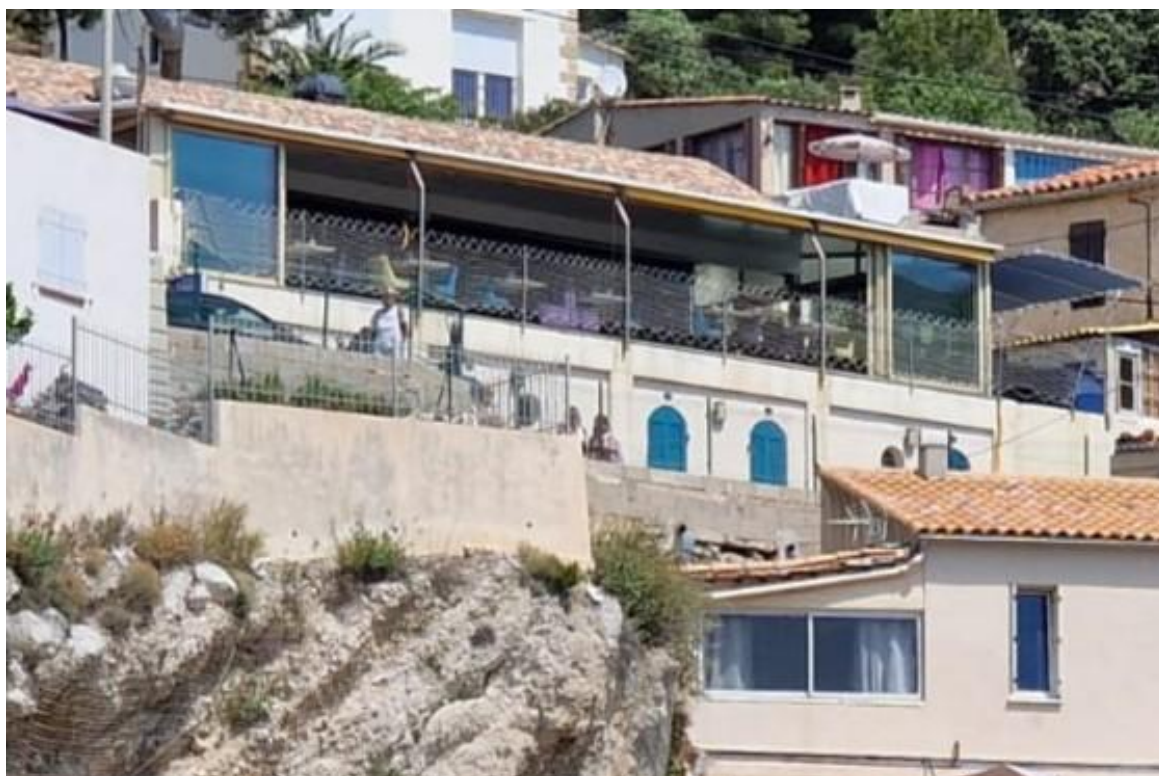
Auberge du Mérou (Photo Ghislaine Bourrelly, 31/05/2025)