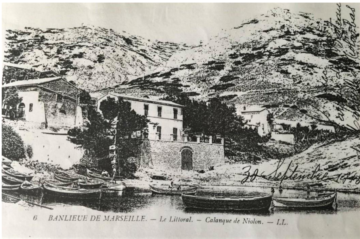
Maison de la Pergola vers 1915

Le bâtiment actuel qui abrite La Pergola a été construit vers 1880 environ, vraisemblablement pour loger les nones de la paroisse. Pendant la seconde guerre mondiale, compte tenu de son emplacement exceptionnel, elle fut réquisitionnée par les Allemands qui, notamment, se servirent de la cave comme poudrière. C'est après cette période que la Pergola a été vendu pour en faire un hôtel restaurant, où des prostituées de Marseille venaient pour changer d'air.