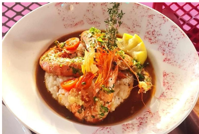
Risotto de scampis à la bisque de homard

L'enseigne, explications (d'après une parution sur Facebook) :