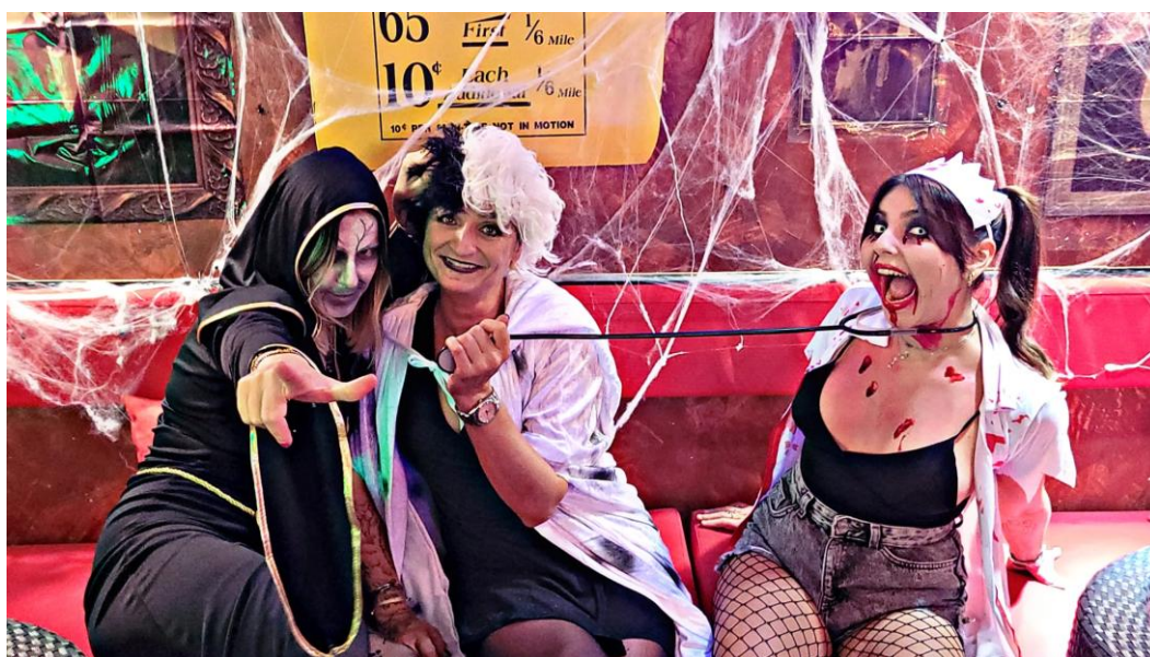
Animation Halloween en 2022