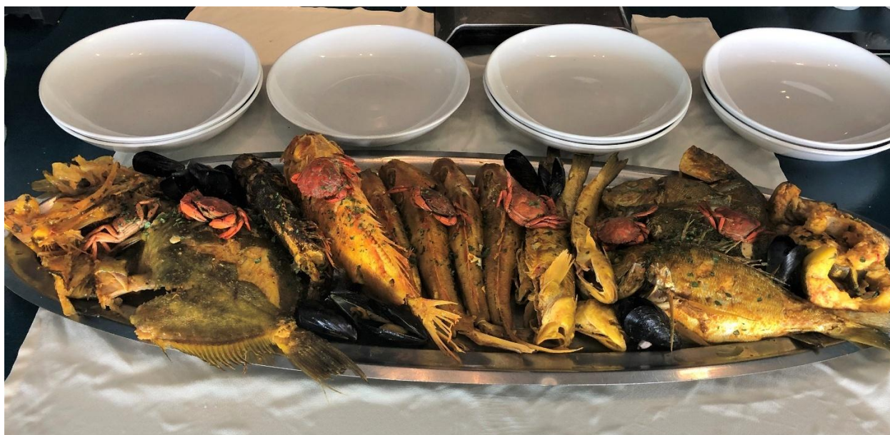
Présentation des poissons de la bouillabaisse, Auberge du Mérou

https://www.tripadvisor.fr/Restaurant_Review-g1226380-d1223899-Reviews-Auberge_Du_Merou-Le_Rove_Bouches_du_Rhone_Provence_Alpes_Cote_d_Azur.html