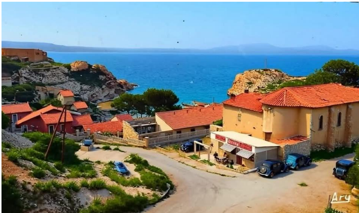
Carte postale du lieu vers 1940-1950