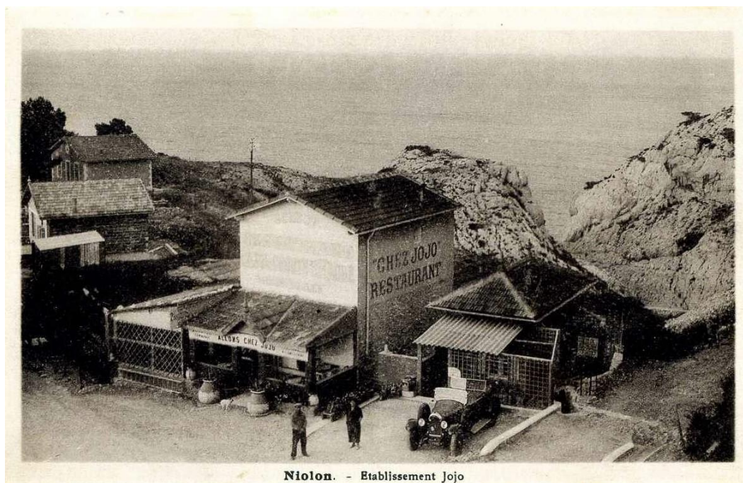
Restaurant chez Jojo, vers 1930