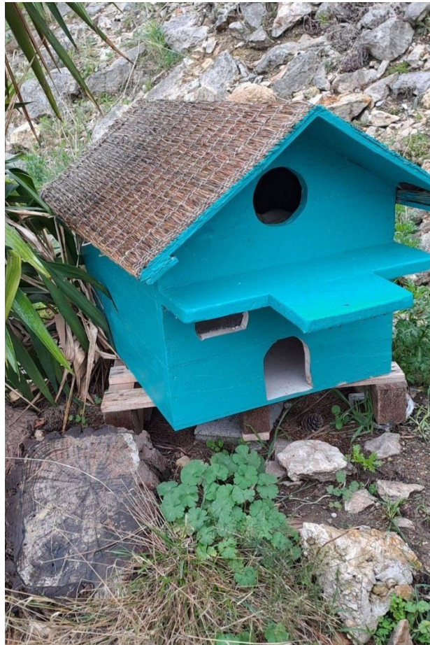
Cabanon félin fabriqué par Petit Louis (2026)