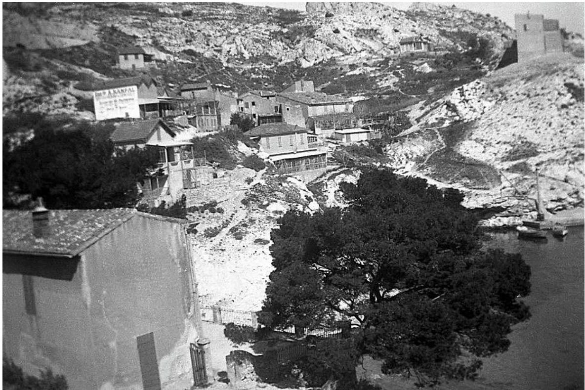
Au premier plan en bas à gauche, la Pergola vers 1930-1940