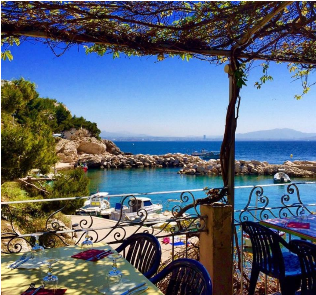
La Pergola, soleil et ombre