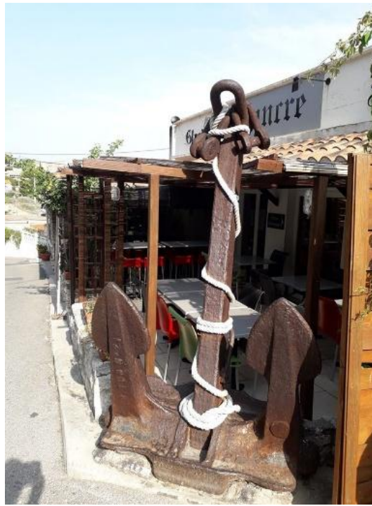
L'ancre en 2018