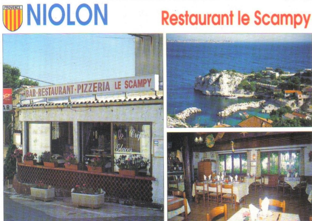
Bar-restaurant-pizzeria Le Scampy