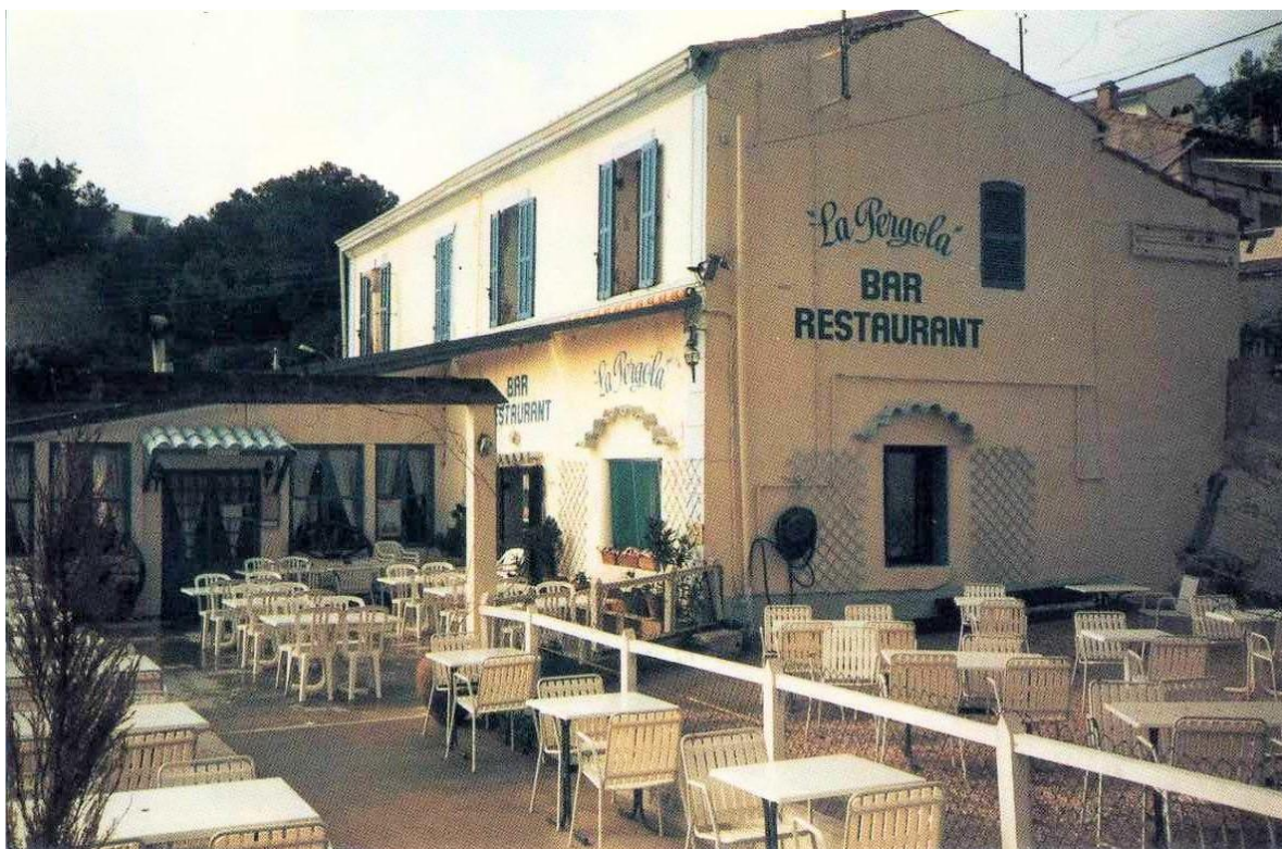
Restaurant La Pergola au début des années 2000

→→ Téléphone réservation : 07 87 96 56 11