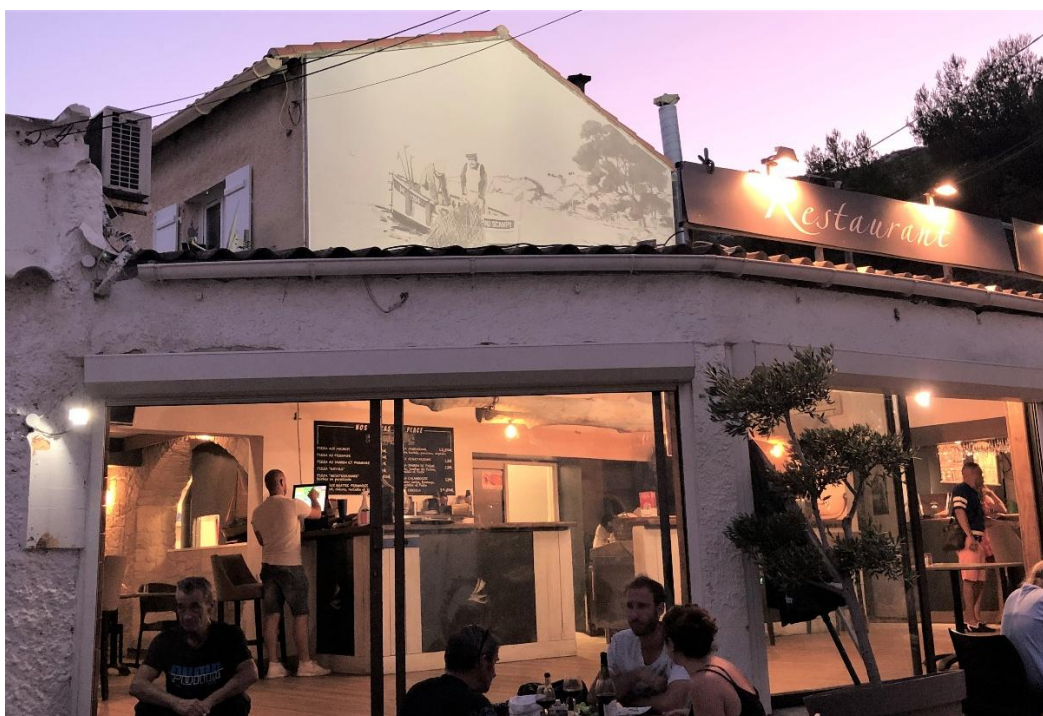
Restaurant l'Escale en 2020