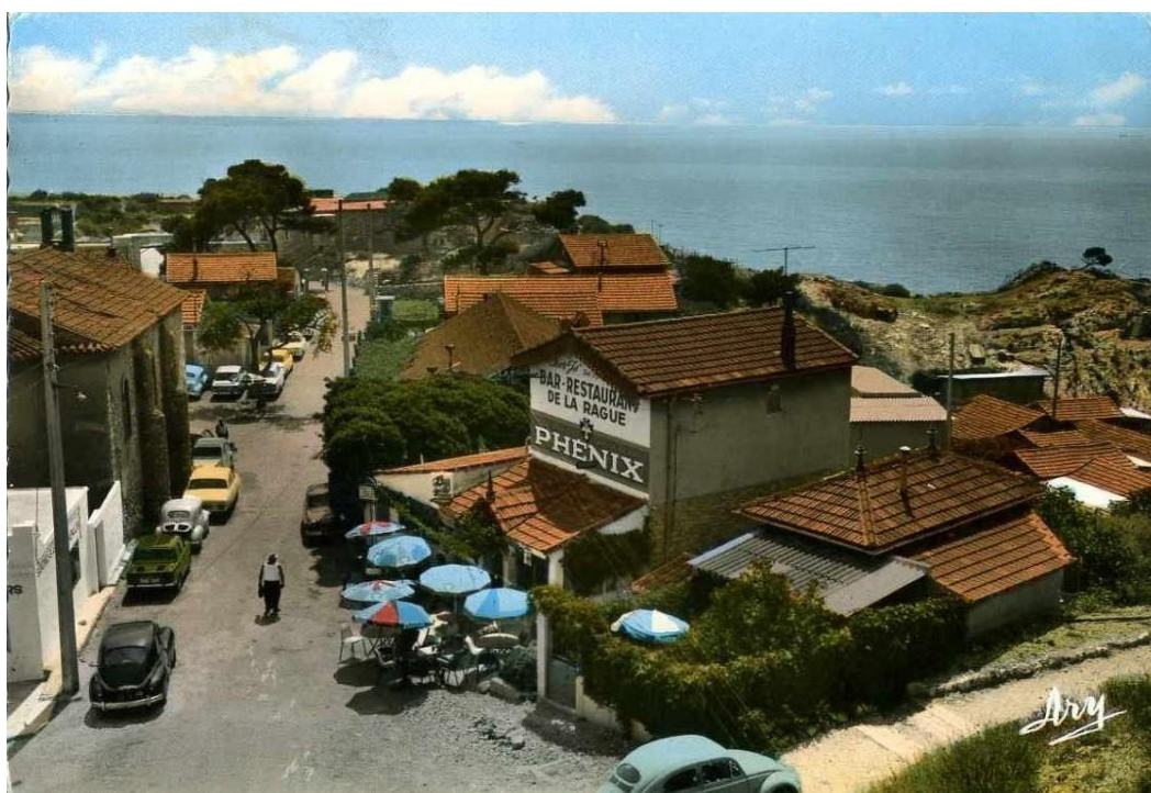
Bar-restaurant de la Rague, vers 1960