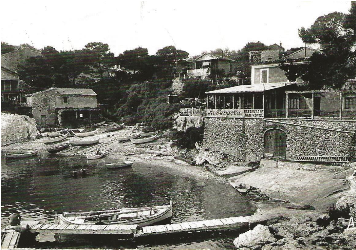
Restaurant La Pergola vers 1950