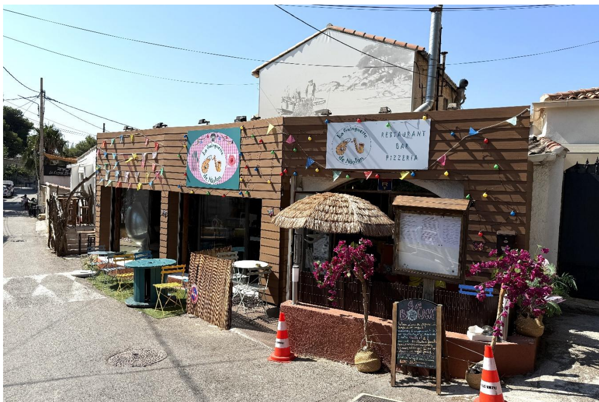
La Guinguette de Niolon (16/08/2025)

→ Téléphone réservation : 06 34 02 07 47