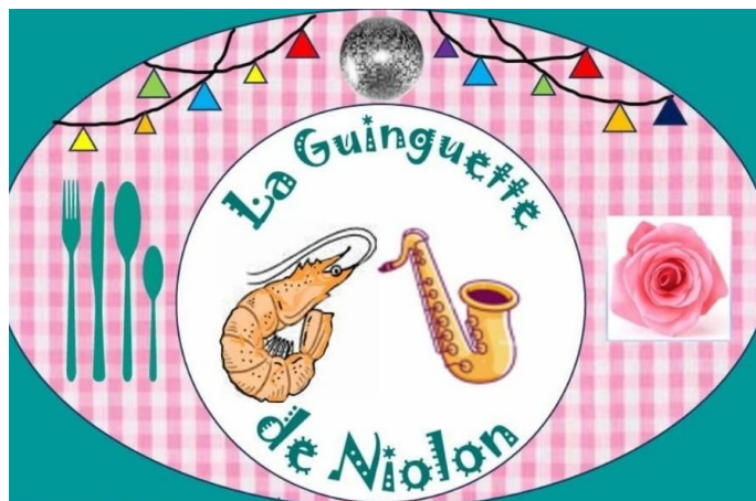
La nouvelle enseigne